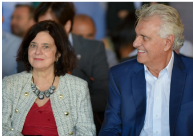
Ministra da Saúde, Nísia Trindade, e Ronaldo Caiado durante inauguração