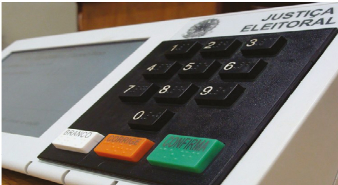
Justiça Eleitoral assegura que resultados do pleito deste ano, mais uma vez, serão fiéis ao desejo do eleitor

Ela opera de maneira isolada. Também não há nenhum mecanismo físico ou digital que possibilite a entrada do equipamento em rede, seja wi-fi, bluetooth ou até mesmo conexão à internet, “e é exatamente por esse motivo que a