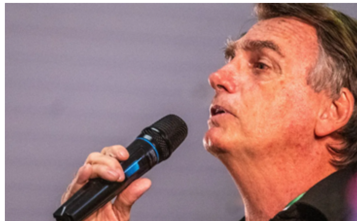
Jair Bolsonaro: pré-campanha do PL em Goiás