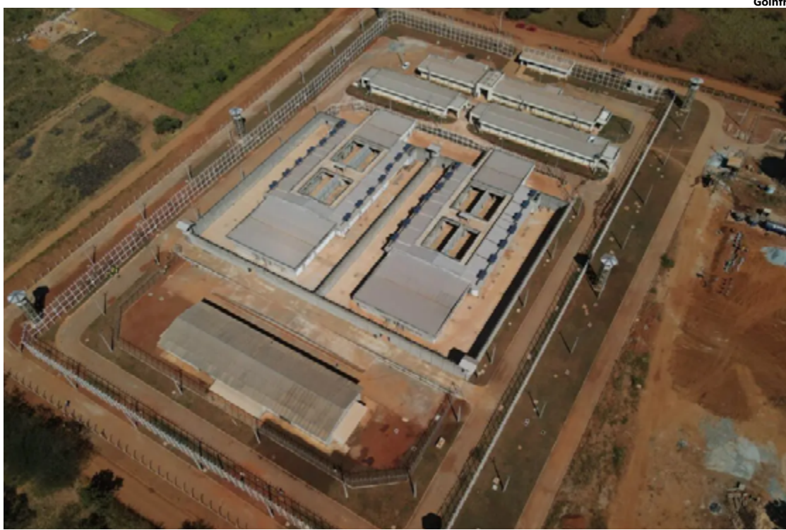
Unidade Prisional de Novo Gama terá quatro alas com 75 vagas em cada, além de áreas administrativas, de saúde, de segurança, de manutenção e vivência coletiva

De acordo com o governador Ronaldo Caiado, o valor de R$ 17,8 milhões empregado na construção se soma a um investimento recorde do Governo de Goiás na região.