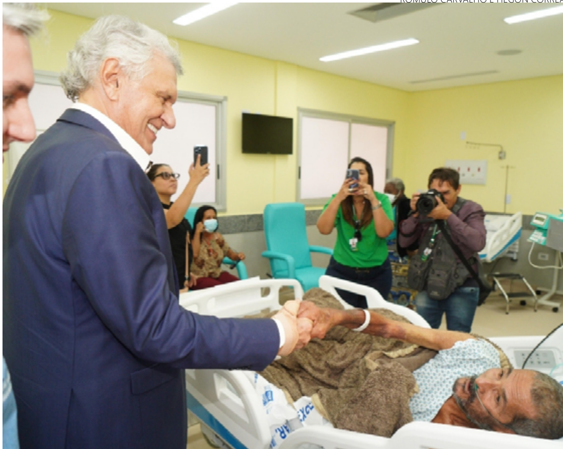
Ronaldo Caiado e gestores conversam com o primeiro paciente do Hospital Estadual de Águas Lindas