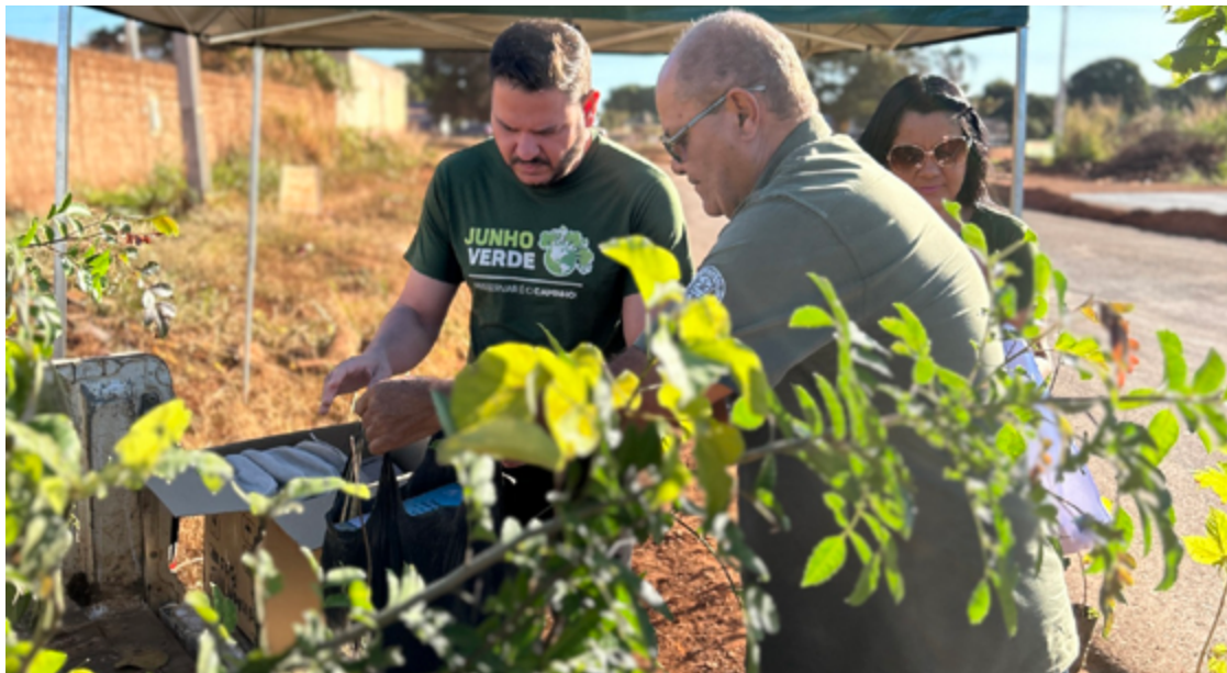
Durante o evento, os participantes receberam material educativo abrangendo uma variedade de temas ambientais

Durante o evento, os participantes receberam material