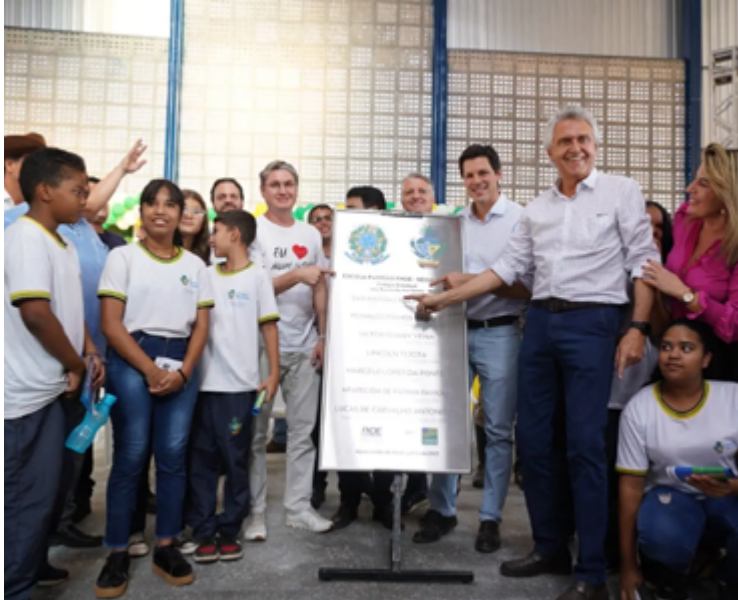
Os investimentos feitos nas escolas da rede estadual do Entorno do DF já apresentam resultados do ponto de vista da aprendizagem

Acabou, por exemplo, o 4º turno de aulas, conhecido como “turno da fome”. Acabaram as obras lançadas e abandonadas, que privavam crianças e jovens do acesso à educação. “Quero deixar bem claro que o Entorno agora tem governo para dar educação, segurança e dignidade à população”, enfatizou o governador Ronaldo