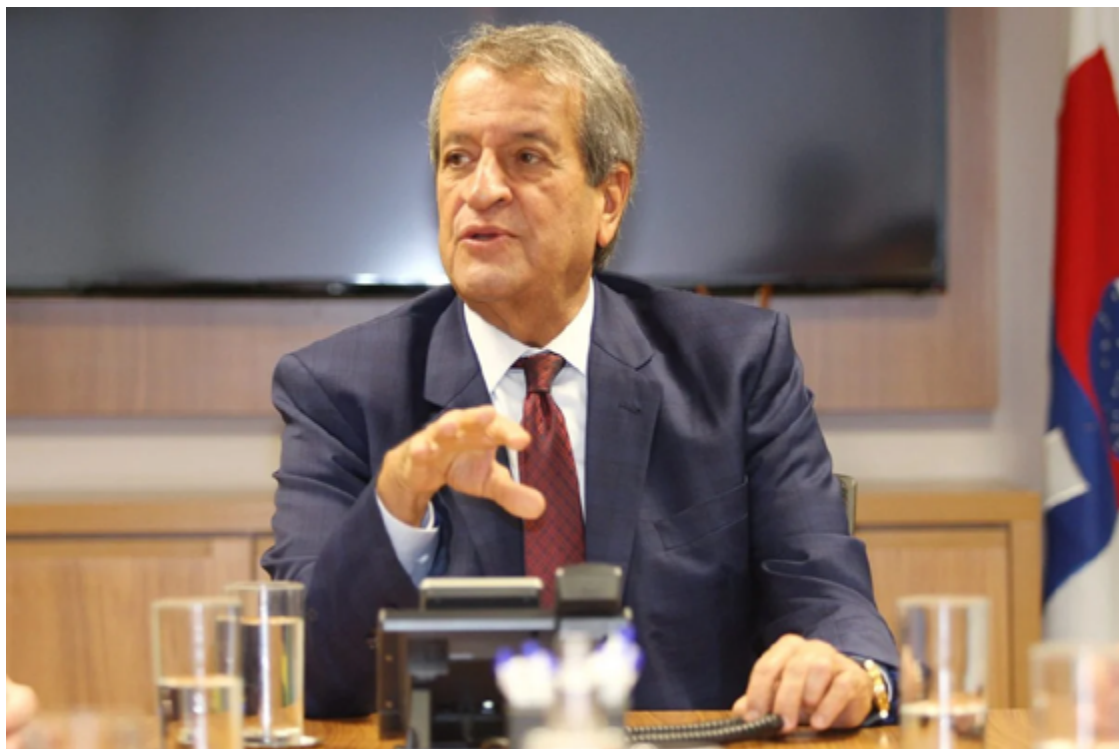
Valdemar Costa Neto: caberá a Jair Bolsonaro Indicar nome do PL ao Palácio do Planalto

De acordo com uma pesquisa da Quaest divulgada no