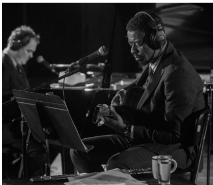
Audiência de milhões: Seu Jorge é ouvido por 14 milhões de pessoas no Spotify

A ideia ali era óbvia: indicar o futuro da bossa nova. Talvez mostrar como o estilo impacta a música pop – sobretudo a sonoridade de Billie Elish (devota ao ritmo brasileiro, já sabemos) e Luísa Sonza (outra apaixonada). Houve até telão do espetáculo na Times Square, principal via da metrópole estadunidense. Transcorreu-se uma hora e meia, duas horas de show.