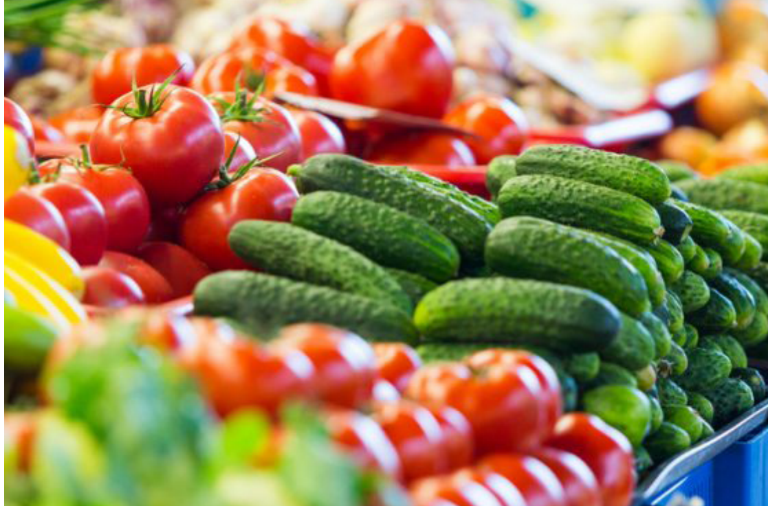
A feira destaca-se não apenas como um ponto de encontro social, mas também como uma vitrine para os produtores locais, que oferecem uma ampla variedade de produtos frescos.

Nas duas primeiras sextas-feiras de junho, o evento contou com atrações especiais que animaram o público presente. No dia 7 de junho, ocorreu o 5º Rodeio Coun-