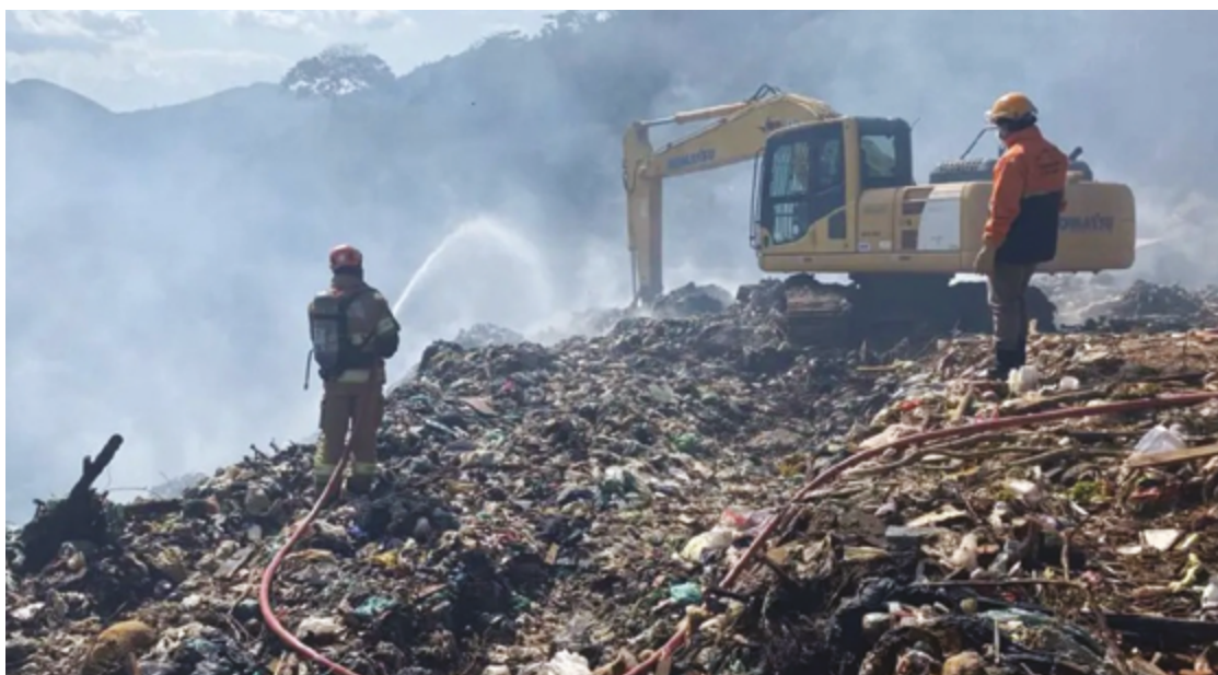
O desafio financeiro enfrentado pelos municípios no encerramento dos lixões foi tema central de audiência na Aleg

Já municípios do tipo 3 têm até 30 de junho para cumprir as exigências do decreto, enquanto os municípios do tipo 4, com população inferior a