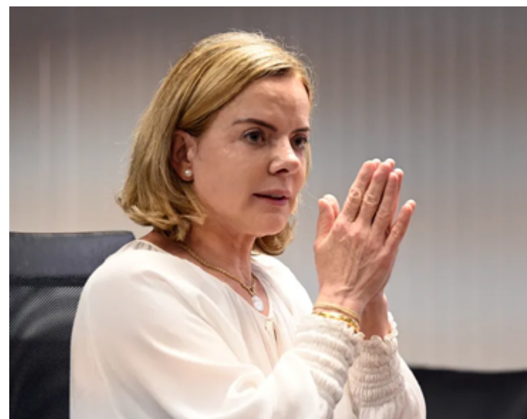
Gleisi Hoffmann: PT prioriza alianças no campo democrático-progressista

“No Rio, estamos conversando com Eduardo Paes e propomos um vice nosso. Ele tem resistência, quer conversar com outros partidos, mas temos dito que é importante ver um vice nosso na chapa, porque sabemos que a eleição no Rio não vai ser fácil”, afirmou Gleisi.