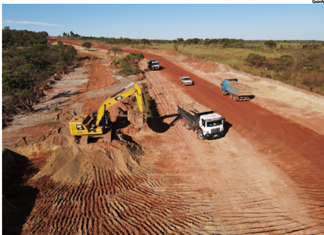
Máquinas estão na pista para recuperar as rodovias que atendem os municípios próximos a Brasília

Além da unidade de saúde, que recebeu R$ 157 milhões em recursos, as máquinas estão na pista para recuperar as rodovias que atendem os municípios próximos a Brasília. Estão em curso a pavimentação de 23 quilômetros da GO-474 (de Abadiânia ao Lago de Corumbá IV), com investimento de cerca de R$ 30 milhões; de 7,8 quilômetros da GO-338 (de Goianésia a Pirenópolis), com o valor de R$ 12 milhões; e outros 14,7 quilômetros da GO-591 (Cabeceiras à divisa de GO/MG), com investimento de mais de R$ 30 milhões.