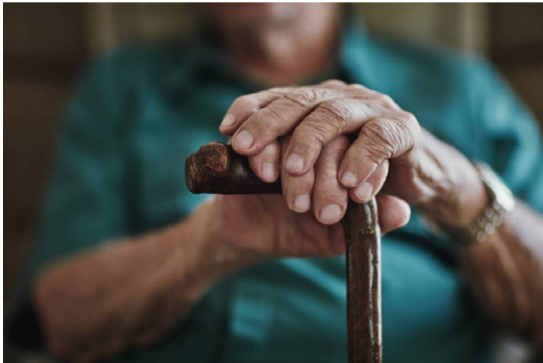
O evento é realizado em alusão ao Dia Mundial de Conscientização da Violência Contra a Pessoa Idosa, comemorado em 15 de junho

A programação da tarde, que ocorrerá das 13h às 17h, inclui uma série de atendimentos essenciais para a população idosa. Entre as atividades previstas, destaca-se a emissão de carteira e passaporte do idoso, documentos importantes que garantem benefícios e direitos específicos para essa faixa etária. Além disso, haverá uma roda de conversa sobre violência contra o idoso, onde especialistas discutirão formas de identificar, prevenir e combater esse tipo de abuso, que